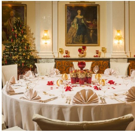
Festsaal 130 m 2 - in 3 Teile unterteilbar