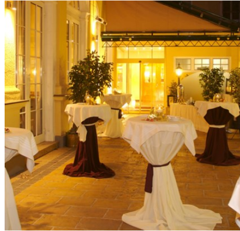
Weihnachtsaperitif im stimmungsvollen Hofgarten